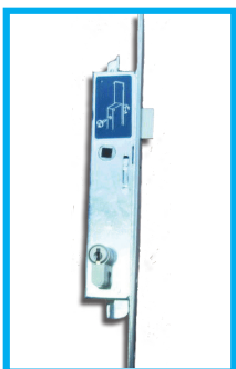
SERRATURA A CILINDRO (2) CON PROFILO EUROPEO