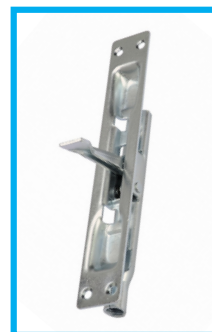
CATENACCIO A UNGHIA (3) SU ANTA SECONDARIA